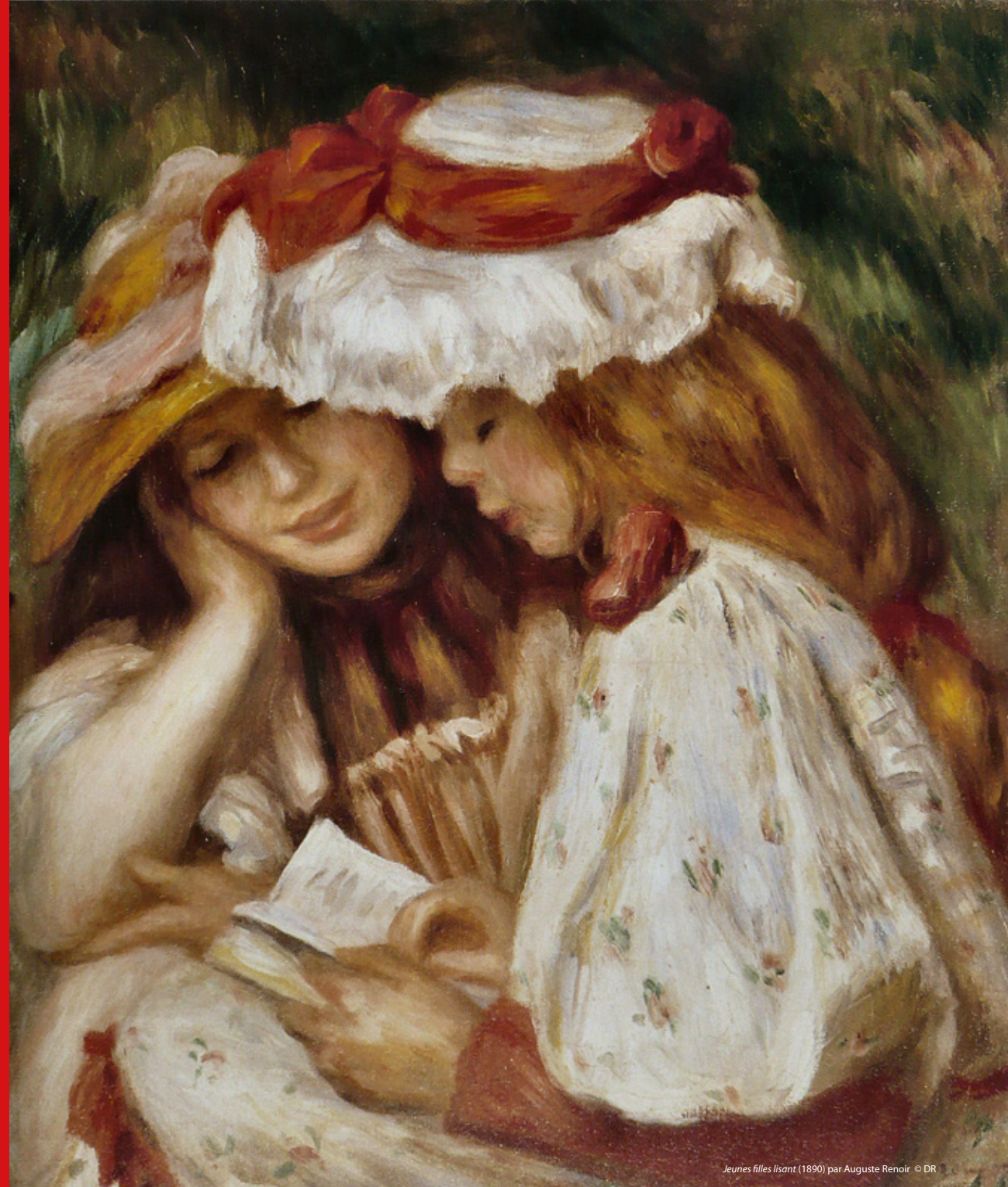
Jeunes filles lisant (1890) par Auguste Renoir